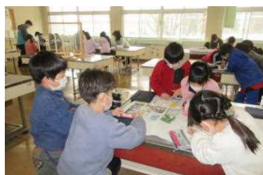
3年 福祉学習をまとめる新聞作り