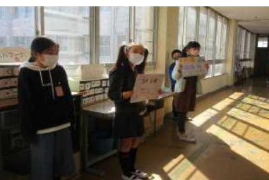
4年 元気に児童会役員選挙運動