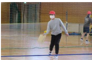
5年 テニピンのラリー楽しいね