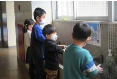
よしのめ 数を数えてしっかり手洗い