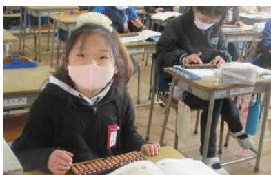
3年 そろばんを使って計算