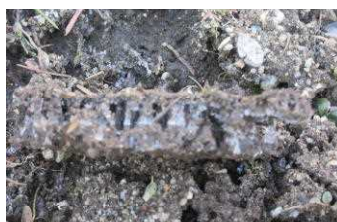
2月末、冷え込みが厳しい朝 花壇に高さが1cmほどの しも柱を見つけました。