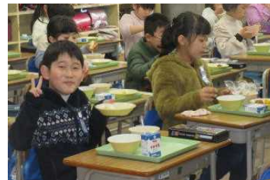
1年 いつも給食おいしいね