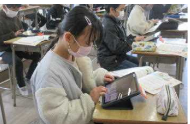
3年 タブレットで「パフ」を弾く