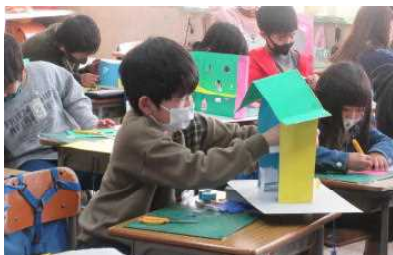
2年 カッターナイフタワー作り