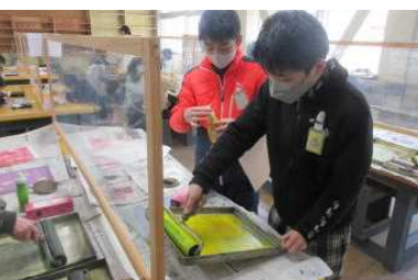
5年 インクを用意して版画を刷る