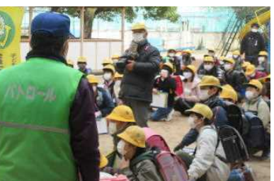
6年 まち協さんと地域の防災学習