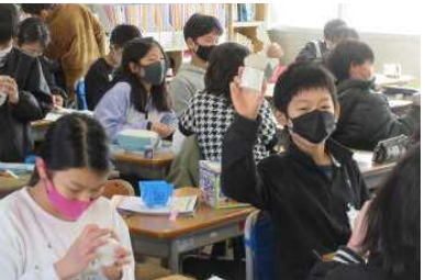
5年 展開図から円柱ができたよ