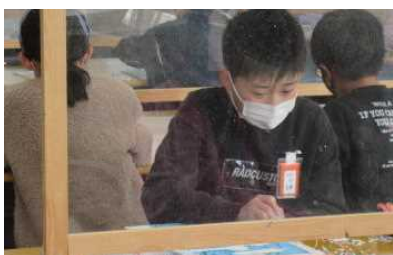
4年 版画の世界に集中して彫る