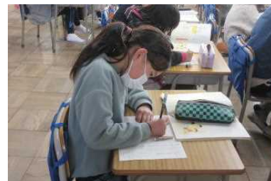
2年 いのちについて考えよう