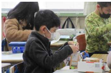
2年 いろいろな箱の形を調べる