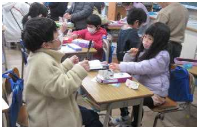
1年 昔の遊び「とんとん相撲」