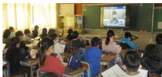
教室で立候補者の演説を聴く3年生

令和4年度の児童会をリードする児童会役員選挙に、5年生から6人、4年生から13人が立候補し、2週間の選挙運動が行われました。昇降口や正門・北門でのあいさつ運動と宣伝活動、給食時の放送による演説活動、休み時間の昇降口での宣伝活動等、大変精力的で感心しました。どの候補者も、吉小のよさである元気なあいさつを継続しつつ、吉小をさらに明るく、楽しく、元気な学校にしようと、自分のアイデアをもとに、その志を堂々と伝えていました。子どもたちの姿はすばらしかったです。全員が当選してほしいと思ったほどです。2月21日(月)、Web会議システムによる立候補者の演説会及び選挙が行われました。3・4・5年生が投票し、以下の結果となりました。今後も活発な児童会活動を期待します。