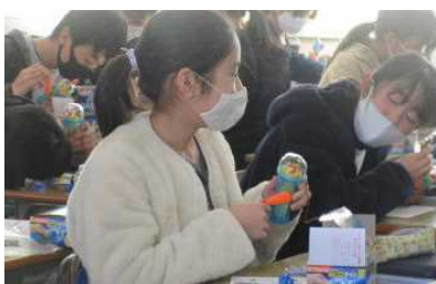
6年 電流が流れると音ができる