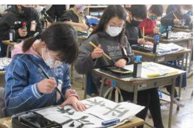
4年 書写「平和」に集中